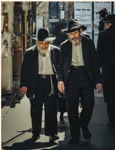
האחים לבית בלוך בשוק במאה שערים

א ת השורות הללו אני כותב בסיעתא דשמיא ביד רוטטת. מעולם לא זכור לי שכשהייתי צריך לכתוב על דמות מסויימת, כל כך חרדתי כפי שאני כעת חרד לכתוב את המילים הבאות: