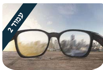
הרב אהרון לוי לא רואים בעיניים