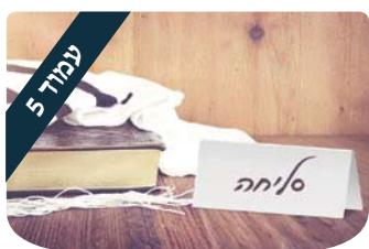
הרב דוד ברוורמן עשרה תובנות בפיוס