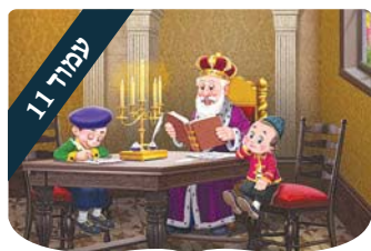
עריכים לילדים מצא את ההבדלים

אבל רופא...?! להציב אותו בפתח המרכול השכונתי; זה מכזיב צורה.