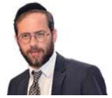
הרב משה לנדא