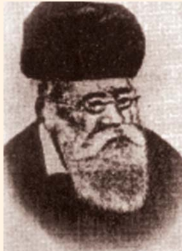
כ"ק האדמו"ר האדמו"ר הראשון רבי יהושע ה'שר שלום" מבעלזא זיע"א

העלון מופיע בחוברת "טועמיה" המופץ חינם במיילים. ניתן להצטרף במייל m025004569@gmail.com