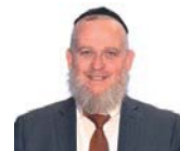
הרב זוד ברוורמן