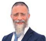
הרב מיכאל לסרי