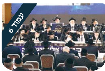
כנס עריכים השיבונו ד' ונשובה