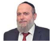
הרב דניאל נשיא