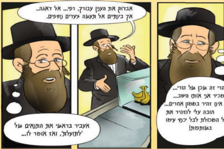
האיורים: ד"ר יצחק גינדין