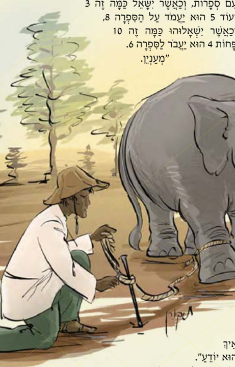
איה הוא יודע.

כל ציץ, צנתוק, רטט קל, יקפיץ אותם להענות למכשיר, בכל זמן ועת. הרי אלו קנו אדון לעצמם. יש פאלו שנתן אוילי להגדיר אותם קעבד נרצע. תוכל לראות אותם עם רצועות תחובות באזניהם תמיד. וכיום עם איזה חפץ אחר שתחבו לאזנם לקלט הכל. און זו ששומעה... יש עוד הרבה סוגי עבדים לכל מיני דברים, אך ברצוני להתמקד על עבדים שהם במצרים, ואין פנתי לארץ מצרים, אלא למצרים וגבולות שהציבו לעצמם. חסמו את צמיחתם. הם פבלו את עצמם באזורים, פן, הם עוללו זאת לעצמם. יכאן ברצוני לספר לך ספור: נהוג היה בעבר לקום 'קרקס נודד'. מה זה 'קרקס'? "אה, אשךר'ק שאתה לא יודע. אכן, כל דבר אחר מלבד מה שלומדים ביישיבה אתה לא אמור לדעת. ובכל זאת לצורך הענין הנוגע אלינו - אספר לך. קרקס הוא מקום בו מצגות חיות מאלפות פבלובים, הצבור ומזמן לחזות בפעלולים למיניהם של החיות המאלפות. המאלף מוציא כל תיה, לפי סדר מסים, אל רחבה גדולה מקפת גדר, עבור הצופים מייעדים שורות של מושבים, משם יכולים הם להתבונן ולראות מקרוב אחר החיה המאלפת. זה יכול להיות סוס שיורו לו להדקף על שתי רגליו האחוריות. או שיתנו לו לפתור שאלה בחשבון. על הרצפה גיחו משטח עם ספרות, וכאשר ישאל כמה זה 3 ועוד 5 הוא יעמד על הספרה 8, וכאשר ישאלוהו כמה זה 10 פחות 4 הוא יעבר לספרה 6. "מענין."