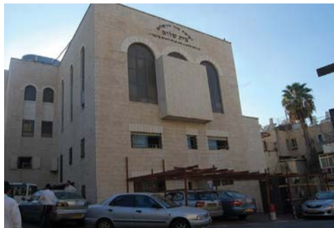
ישיבת מיר

"אכן", צהלה השכנה אחר שנסתה לפתח את ברז המים במטבח. "אמנם, העניין הסתדר!" 'נו... שוה לגור ליד אדם חשוב ונכבד כמו הרב פינקל. לא נעים להטריח אותו, אבל עניינים מסתדרים היטב תחת ידיו. שם בעירייה יודעים לכבד אותו. כך הרהרה.