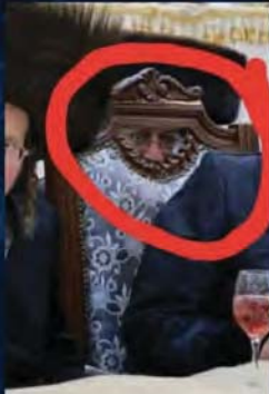
אף פעם לא ידעתי למה משמש החלון בכסא

בעבודה אני תמיד מתחנא לחנול שלי, כי עובדים טובים קשה למצוא.