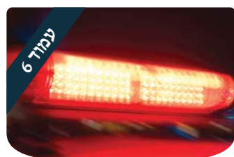
הניצוץ היהודי מבירא עמיקתא לאיגרא רמא