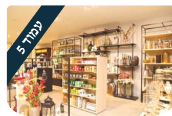
הרב מיכאל לסרי צורך חיוני או מותרות?