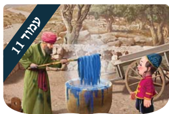
ערכים לילדים מצא את ההבדלים

הכיצד לא נחרד מכך שמאתיים וחמישים מקריבי הקטורת צועדים אל מותם בעיניים פקוחות?