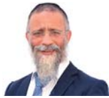
הרב מיכאל לורי