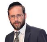
הרב משה לנדא