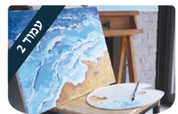
הרב הרב דוד ברוורמן המעט-מכם