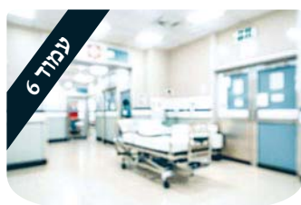
ערכים מאחורי הקלעים לתפוס את הרגע