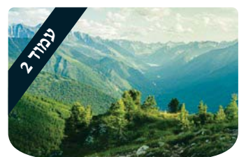
ערכים 2 הרב דוד ברורמן להתנחם