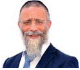
הרב מיכאל לסרי