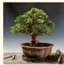
המשך מעבר לדרך

עלה אליהם הרב, דפק בדלת, פתח הבעל את הדלת ונראה כמו מלאך חבלה... 'אין פה צדקה!' אמר הבעל בזעם 'לא, לא צדקה' אמר הרב 'לא תפילין, לא כלום, חבדני"ק עוזב אותי!' 'אני לא חבדני"ק' השיב הרב 'רק רוצה לדבר רגע' 'שום לדבר' ותוך כדי משיכים הבעל והאשה לגדף אחד את השניה רחמנא לצלן והרב לא ותר ואמר להם בין הצעקות: 'אני רואה שאתם רבים ואין ביניכם שלום בית' 'וו וו אל תתערב, שלום בית אומר לי...' אבל הרב היה עקש ואמר: 'אתה יודע שיש חברה בסין שמייצרת עציצים, ששמים את העציץ בחלון, צריך רק להשקות אותו, והעציץ הזה גורם לשלום בית' 'מאיפה המצאת את השטויות האלה?!' אמר הבעל 'תן לי את הרשות לקנות לך את העציץ הזה ותראה שזה פועל לשלום בית' הביט הבעל באשתו והיא אמרה 'יאללה, שיביא את העציץ'