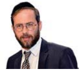
הרב משה לנדאו