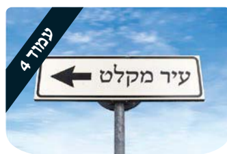
ערכים 4 הרב דניאל נשיא הפסיכולוגיה של השגנה