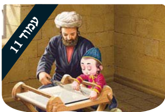
ערכים לילדים לקראת שבת

ואת החוט המקשר האחרון הזה, עם כלל ישראל ועם מורשת התורה, גם יהודים רחוקים יבקשו לשמר